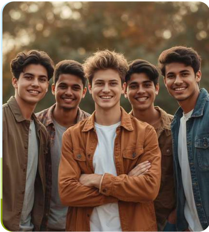
LỚP NAM - BẢN LĨNH