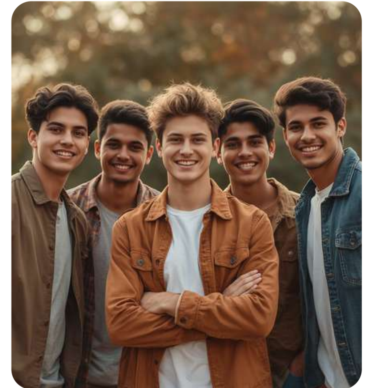
LỚP NAM - BẢN LĨNH