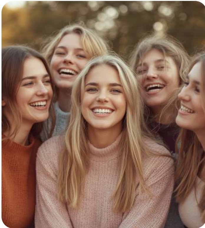
LỚP NỮ - TỰ TIN